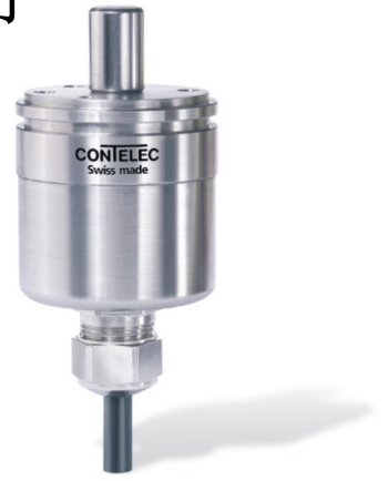
Vert-X 37 - 5V / PWM 订购代码